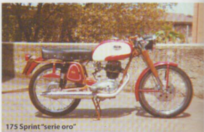
175 Sprint "serie oro"

Mondial 175 Sprint carattere sportivo e motore brillante