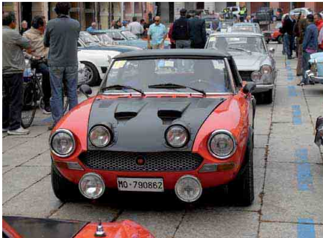
Sopra un'immagine dello scorso anno. Sotto panoramica del Museo Bariaschi