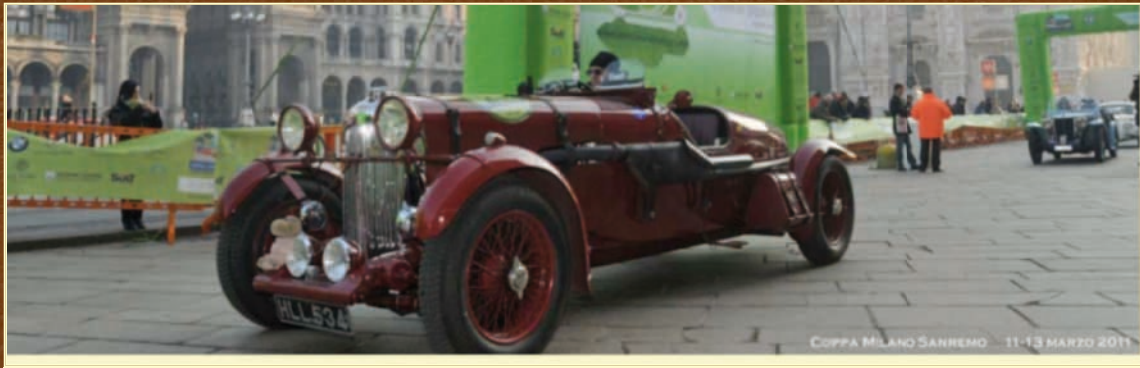
COPPA MILANO-SANREMO 11-13 MARZO 2011

EVENTI TOP EVENTS ANNUNCI DEALERS QUOTAZIONI NEWS INSERISCI CLUB ISCRIVITI