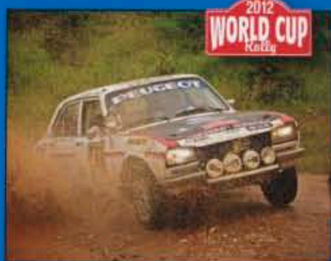
LONDON TO CAPE TOWN