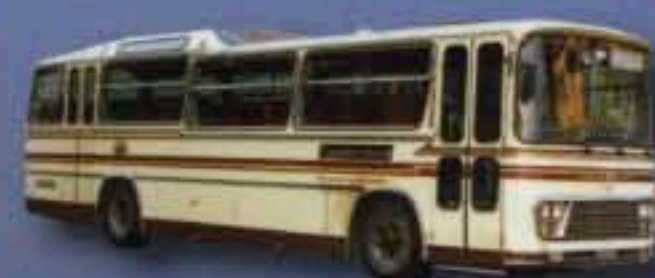
AUTOBUS FIAT 343