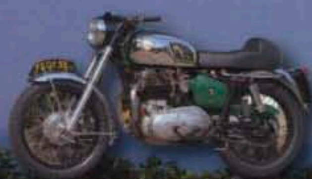
ROYAL ENFIELD INTERCEPTOR

Nata nel 1962 rimane una dei più brillanti successi della Casa di Arese, comoda, brillante, veloce, ha rappresentato l'auto in dotazione alle Forze dell'Ordine, per eccellenza