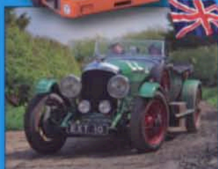
THE FLYING SCOTSMAN