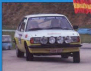
RALLY COSTA BRAVA