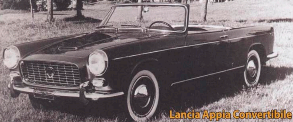
Lancia Appia Convertibile

Moto, bici e radio: è la collezione Salsapariglia Endurance , Ritorna il campionato mondiale