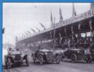
LA COPPA ACERBO