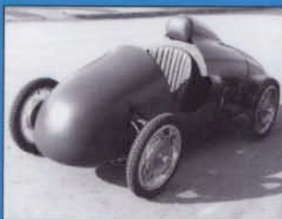
LE MONOPOSTO NARDI