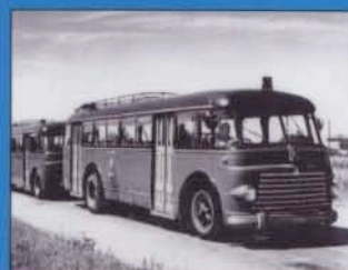
AUTOBUS FIAT 680